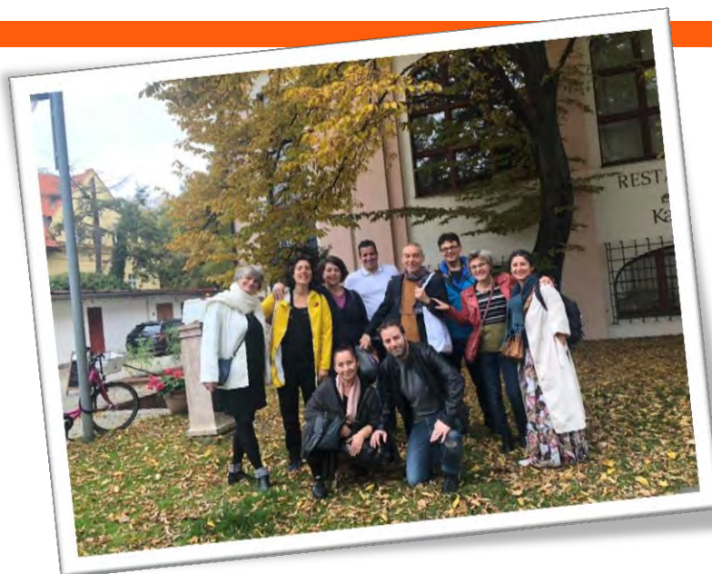
Po skončení našeho úžasného workshopu „Psaní scénáře“ a „Fyzického divadla“ v Divadle Kampa v Praze