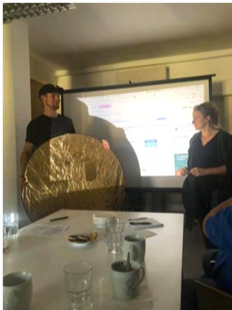
Příprava na natáčení dokumentu a technické pokyny