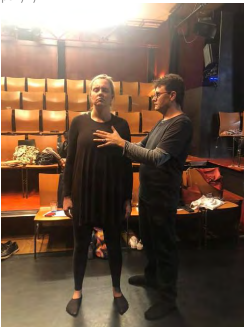
Workshop fyzického divadla