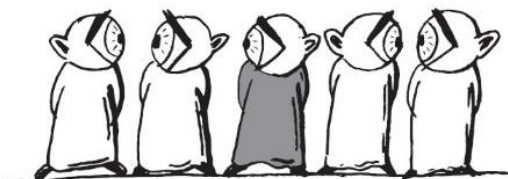
POKOJÍČEK - KOMUNITNÍ CENTRUM

KC Pokojíček plynule navázal na již realizované počiny společnosti Art Movement zaměřené na začleňování CS osob s duševním onemocněním do běžného života (projekty Paralelní životy 1-4, Paralelní světy a Oko- mobilní komunitní centrum I. a II.) Zajišťuje potřebnou kontinuitu a stabilitu při poskytování destigmatizačních aktivit. CS získá možnost pravidelného setkávání jak mezi sebou, tak s ostatní, běžnou veřejností.